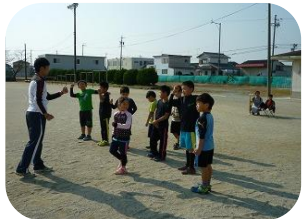
走るには正しい腕の振り方が重要です♪