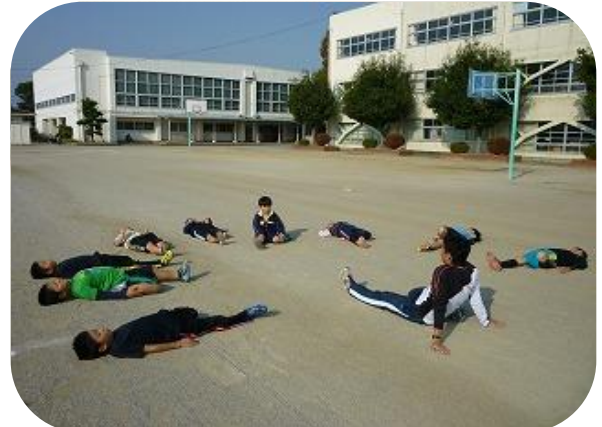
ストレッチ♪しっかり体をほぐそう