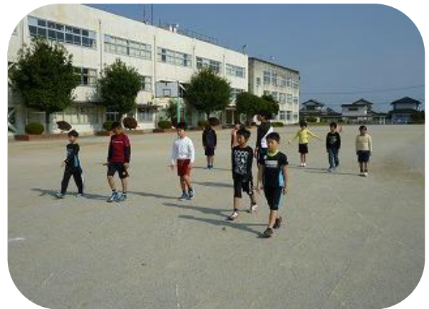
正しい姿勢で歩いてみよう♪