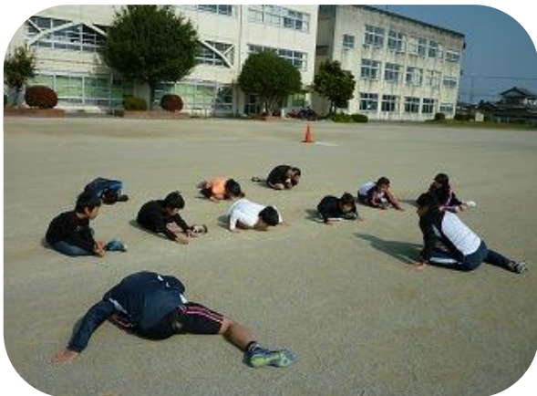
まずはストレッチ(*^_^*)