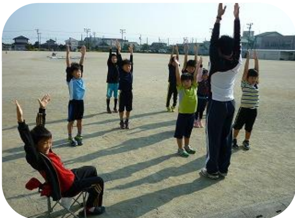
正しい姿勢になる方法を教えてください♪