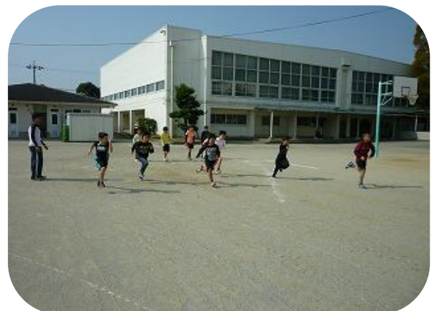
さあ、走ってみよう(^_^)v