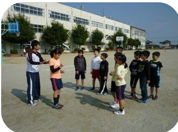
腕の振り方は重要です！